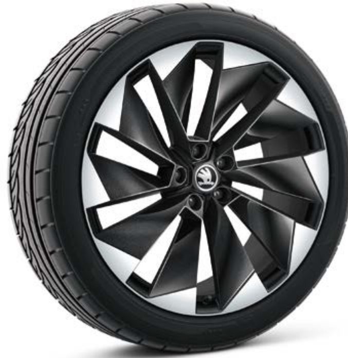
21" Zwart Supernova